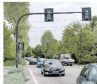
L'INVIOLATO Per il collegamento sotterraneo investiti 97 mila euro

Metà del finanziamento è coperto dall'Ipermercato Lando a seguito dell'ampliamento della superficie di vendita (ridistribuzione interna degli spazi di vendita e di lavorazione, senza alcuna modifica all'involucro esterno della struttura di vendita esistente); una tale intervento ha stan-